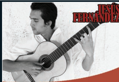
guitarrista de Flamenco (Almería) · 670 356 755

Programación mensual y mucho más en: www.casapatas.com casapatas@casapatas.com Telf: +34 91 369 04 96