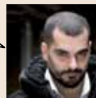
Junior Artista para