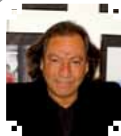
Tony Garlif director de cine film maker réalisateur