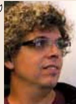
Pedro Guerra músico