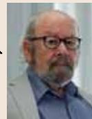
J.M. Caballero Bonald Writer