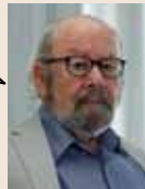
J.M. Caballero Bonald Escritor Extracto del Prólogo