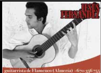
guitarrista de Flamenco (Almería) - 670 356 755

Pasillo Santa Isabel, 5 · 29005 Málaga 952 214 778 · www.flamenka.com